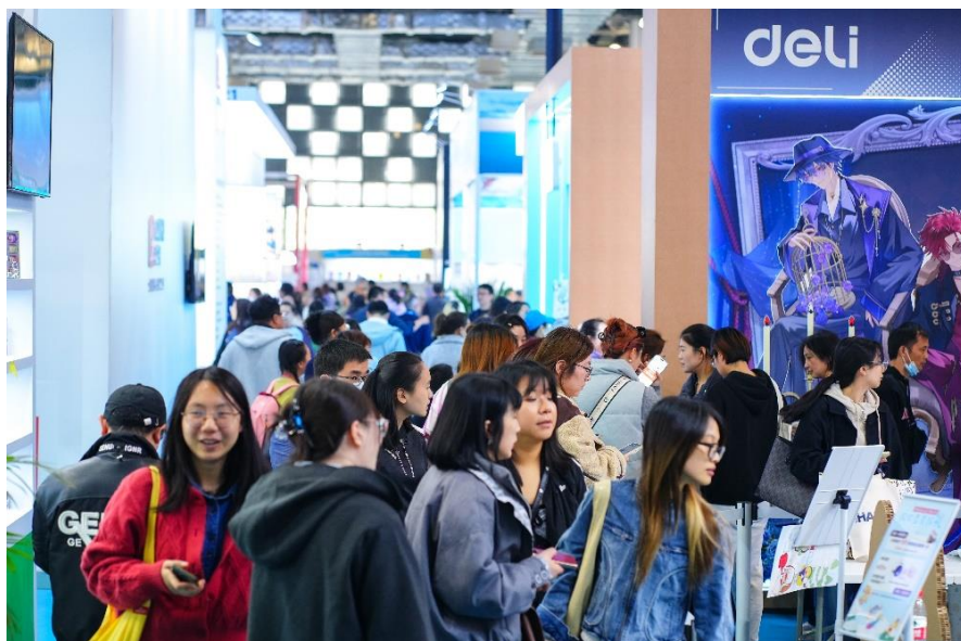
Paperworld China 2025 现场

法兰克福展览（香港）有限公司副总经理张菁女士表示：“如今的文具、美术及文创产品，已经不再只是单纯的实用工具，而越来越多地承担起支持身心健康、表达个性与传递情绪价值的功能。这不仅反映出消费者需求的变化，也代表着整个行业正朝着更具人文关怀与设计导向的方向发展。今年的展会清晰展现了这一趋势：品牌们围绕原创理念与用户体验展开布局，通过设计驱动线下互动，让产品既满足功能性，又贴近不同年龄层消费者的生活方式与情感共鸣。由此可见，设计正逐步成为连接商业诉求与个体需求的关键纽带。”